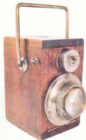
'Ever ready', handlamp van teakhout, begin 1920er jaren

over de geschiedenis van de betreffende fabrikanten heb ik vervolgens een aantal van de (weinig) nog bestaande onderne-