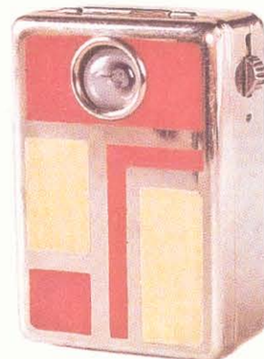
'Erkala', mini-zaklamp in Art Deco-stijl, ca 1925