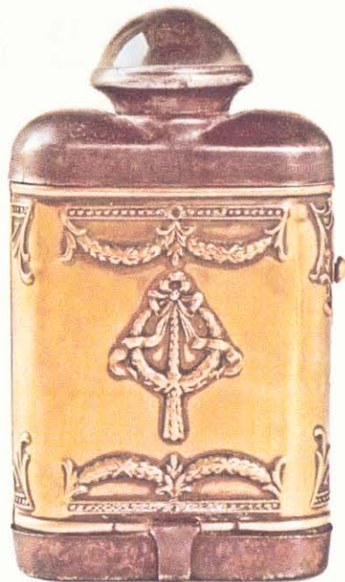
Merkloze zaklantaarn met Jugendstil-motief, ca. 1910

"Om wat meer te weten te komen van de verschillende merken en