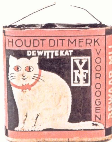
'Witte Kat', platte 4.5 V batterij, 1940er jaren

geschiedenis van de betreffende fabrikant, voor zover bekend, beschreven en geïllustreerd met een groot aantal foto's en afbeeldingen.